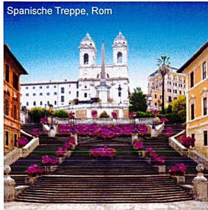
Spanische Treppe, Rom

Am Vormittag Außenbesichtigung des Kolosseums, dem Amphitheater der Flavierkaiser, wo Tierhetzen, Gladiatorenkämpfe und sogar Seeschlachten veranstaltet wurden. Anschließend führt Sie ein Spaziergang vorbei am Forum Romanum mit den Ruinen der antiken Tempelanlagen, Gerichtsbasiliken usw. bis zum Kapitol. Dort besichtigen Sie die Kirche Santa Maria in Aracoeli, welche im 13. Jhdt. von den Franziskanern errichtet wurde. Feier einer Heiligen Messe. Am Nachmittag spazieren Sie über die Tiberinsel in das malerische Stadtviertel Trastevere, das für seine verwinkelten Gassen und seine lebendige Atmosphäre bekannt ist. Sie bummeln durch das Viertel und besichtigen die beeindruckenden Kirchen S. Maria in Trastevere, S. Caecilia und S. Benedetto in Piscinula. Am Abend erleben Sie